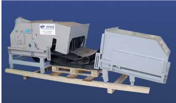
Zum Versand vorbereitete Antriebs- und Spannstation mit aufgezogenem Fördergurt

Als Fördergut kommen alle Schüttgüter, von mehligem Schüttgut bis hin zu grobstückigen Schüttgut in Frage. Im Schüttgutbereich werden üblicherweise Muldengurtförderer oder Wellkantenförderer eingesetzt. Flachgurtförderer bilden im Schüttguttransport eher eine Ausnahme.