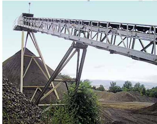
Haldenband in einem Basaltwerk

Muldengurtförderer gehören mit zu den häufigsten eingesetzten Bandförderern im Schüttgutbereich. Der Fördergurt wird durch die Form der oberen Tragrollenstühle in eine gemuldete Form gebracht. Durch die so entstehende Querschnittsfläche wird ein großer Volumenstrom möglich. Durch die gemuldete Form des Fördergurtes ist bei Normalbetrieb ein seitliches Herabfallen des Fördermaterials so gut wie ausgeschlossen.