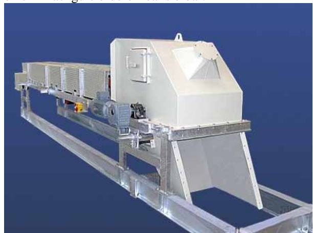
Muldengurtförderer auf Bandbrücke vormontiert

Ein Flachgurtförderer ausgeführt mit seitlichen Führungsleisten wird für grobstückiges Fördergut, z.B. Holz, Reifenschnitzel, aber auch in anderen Bereichen der Recycling-Industrie eingesetzt. Spezielle Anwendungen, z.B. als Reinigungsband unterhalb anderer Förderorgane angeordnet, sind mit einem Flachgurtförderer realisierbar.